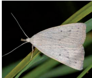
La Cosmie rétuse

Le cortège caractéristique de papillons de nuit des zones humides et phragmitaies est régulièrement observé, avec des espèces à forte valeur patrimoniale : Nascia ciliaris qui vit sur Carex riparia ; Archana dissoluta dont la chenille consomme les phragmites et Coenobia rufa qui dépend de divers joncs. Une autre espèce s'ajoute en 2011 à ce cortège : Macrochilo cribrumalis , une espèce discrète et peu commune dans la région Midi-Pyrénées.