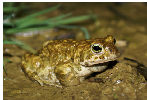
L'ancienne carrière de Saint-Cricq, un site propice aux amphibiens