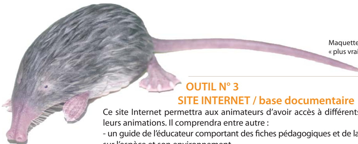
Maquette du Desman « plus vrai que nature ».