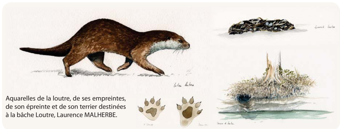
Aquarelles de la loutre, de ses empreintes, de son épreinte et de son terrier destinées à la bâche Loutre, Laurence MALHERBE.

Cet outil a été pensé pour les animations de terrain. Par des représentations visuelles à l'aquarelle, les bâches permettent d'identifier des caractères morphologiques de cinq espèces voisines et d'apprendre à classer les espèces selon des critères choisis ou imposés (taille, formes, couleurs...).