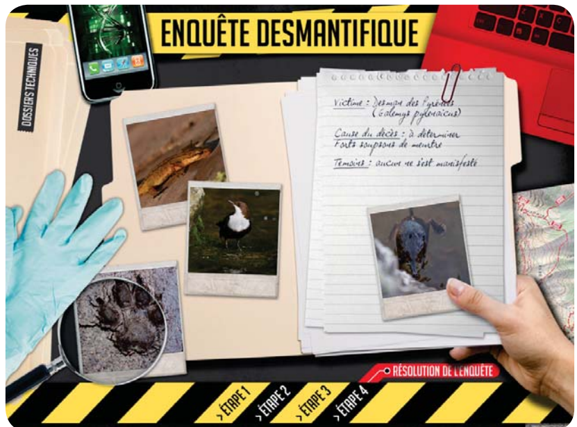
Maquette de l'interface du jeu Enquête Desmantifique, Zookeeper