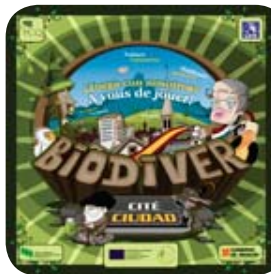
Boîte du jeu biodiver-cité.