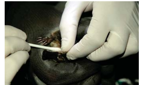
Prélèvement de salive