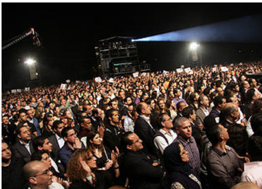
Les nouveaux bénévoles étaient nombreux au rendez-vous de cette formation.