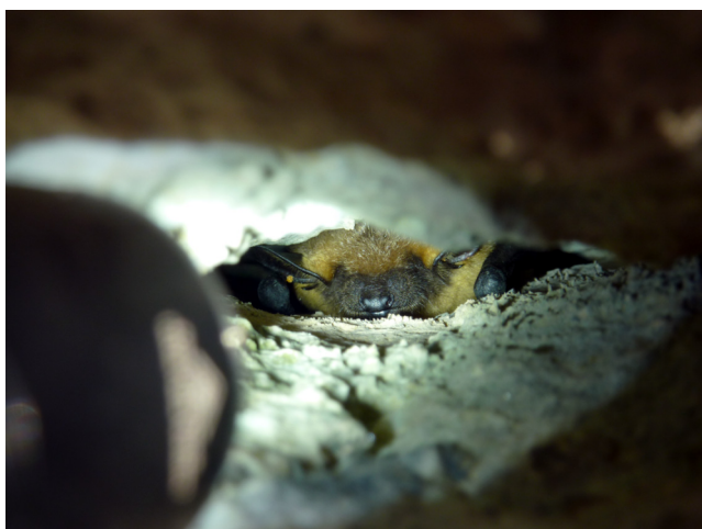
Sérotine commune à Trassouet (65)

Au vu du nombre de sites à inventorier (16 sites) et l'obligation de grimper directement sur les falaises pour inspecter toutes les fissures, cavités ou autres écaïlles, il n'aurait pas été possible dans le temps imparti d'inventorier l'ensemble des 16 sites du projet. Un passage sur l'ensemble des sites a donc été effectué