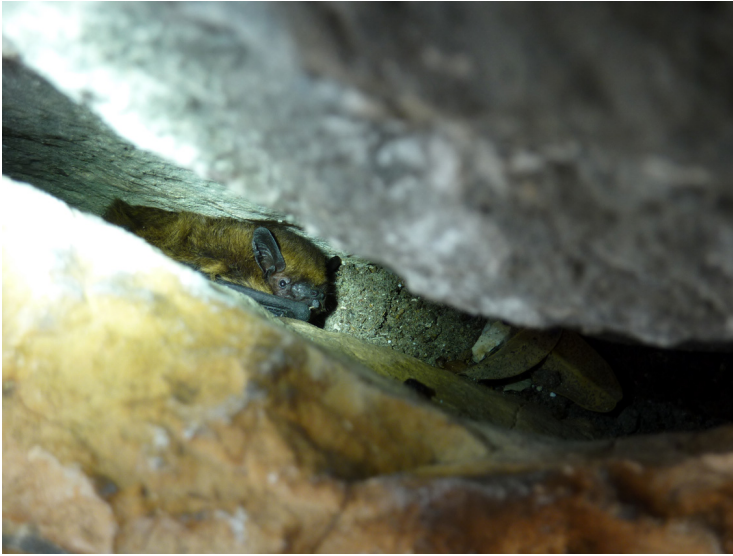
Une pipistrelle commune sur le site de Trassouet (65)

L'utilisation d'une lampe peut faciliter les observations mais parfois l'angle d'éclairage étant trop souvent obstrué par l'étroitesse des gîtes, il n'a pas été possible de bien inspecter les anfractuosités.