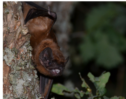
La Grande Noctule du Lézérou (12).